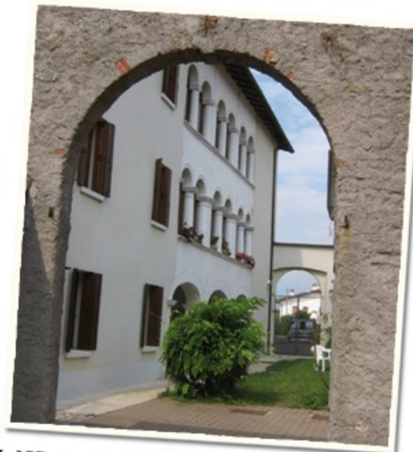
VILLA DEI CANONICI