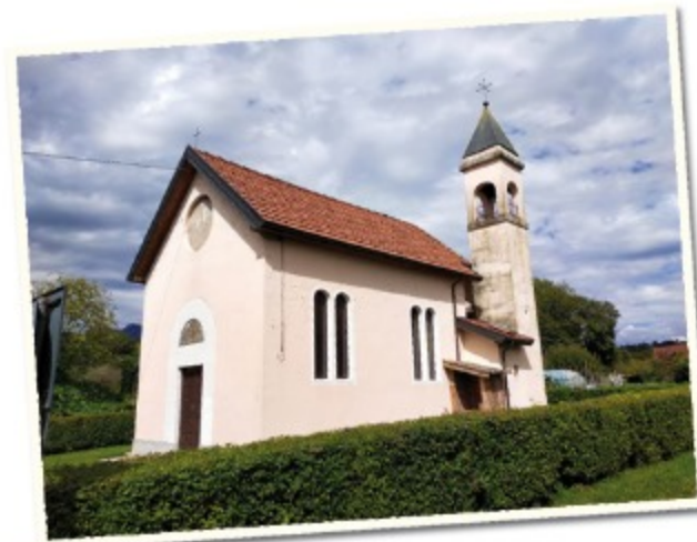
CHIESETTA DI CESA